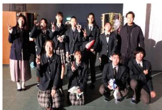
1年普通科「探究発表」