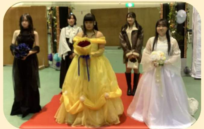
3年2年被服コース「ファッションショー」