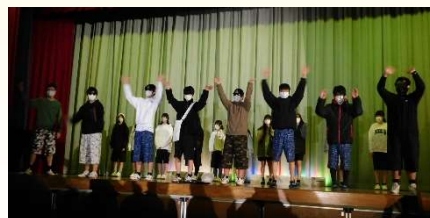
1年家政科「ハーフパンツファッションショー」