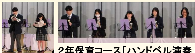
2年保育コース「ハンドベル演奏」