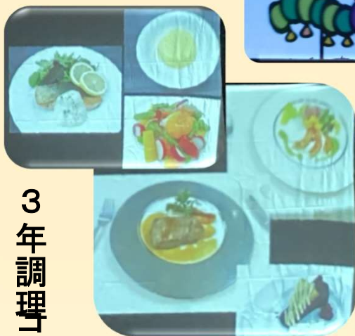
3年調理コース 製作料理