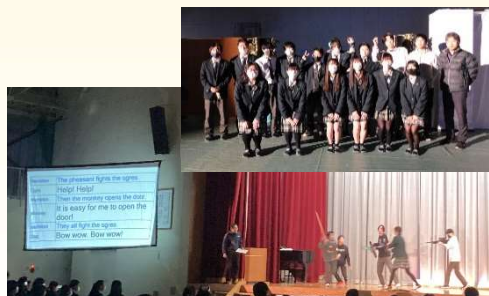
3年普通科「英語劇」(字幕付き)