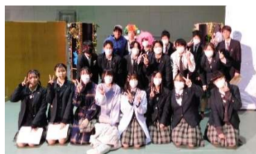
2年普通科「家庭総合発表」