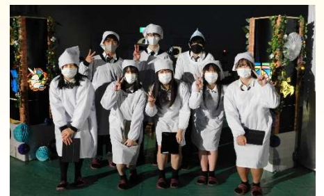
2年調理コース「弁当製作発表」