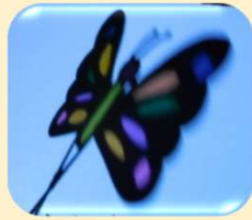
3年保育コース「影絵 はらぺこあおむし」