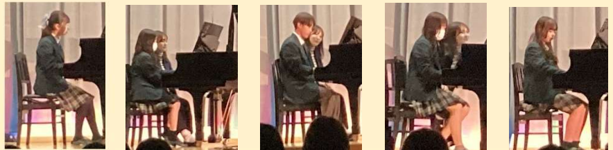
3年保育コース「ピアノ演奏」