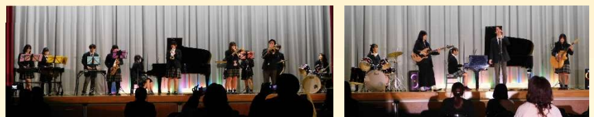
(左)3年音楽選択「合奏」 (右)2年音楽選択「バンド演奏」