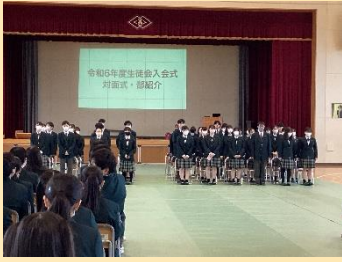
上:対面式 下:生徒大会