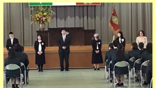
1学年を担当する教員