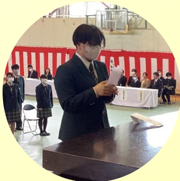
入学式生徒代表の挨拶