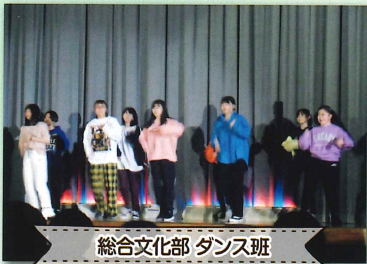
総合文化部 ダンス班