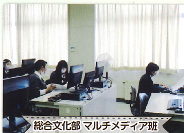
総合文化部 マルチメディア班