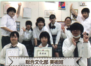
総合文化部 美術班