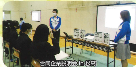
合同企業説明会 in 松高

人間関係を築く、SNS、薬物乱用防止、性教育、進路関係、社会人基礎教育、年金など様々な分野の専門家から講話を聴き、自分のとるべき行動を考える貴重な機会となっています。