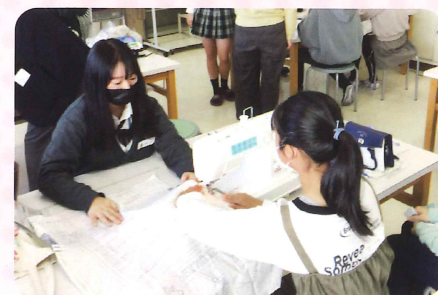
松山小学校交流授業