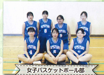
女子バスケットボール部