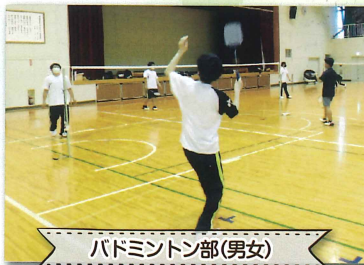
バドミントン部(男女)