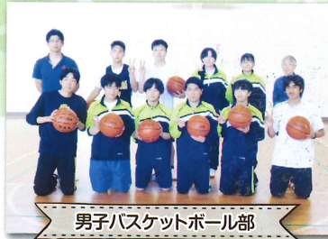
男子バスケットボール部