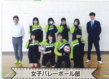
女子バレーボール部