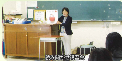
読み聞かせ講習会